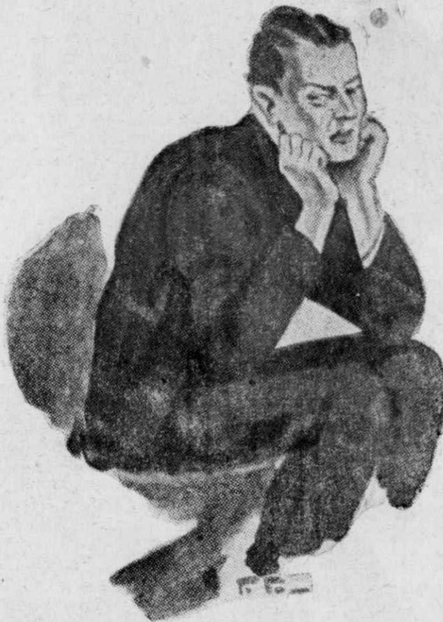
Ο Έρτεν θρискόταν καθισμένος στο κρεβάτι του.