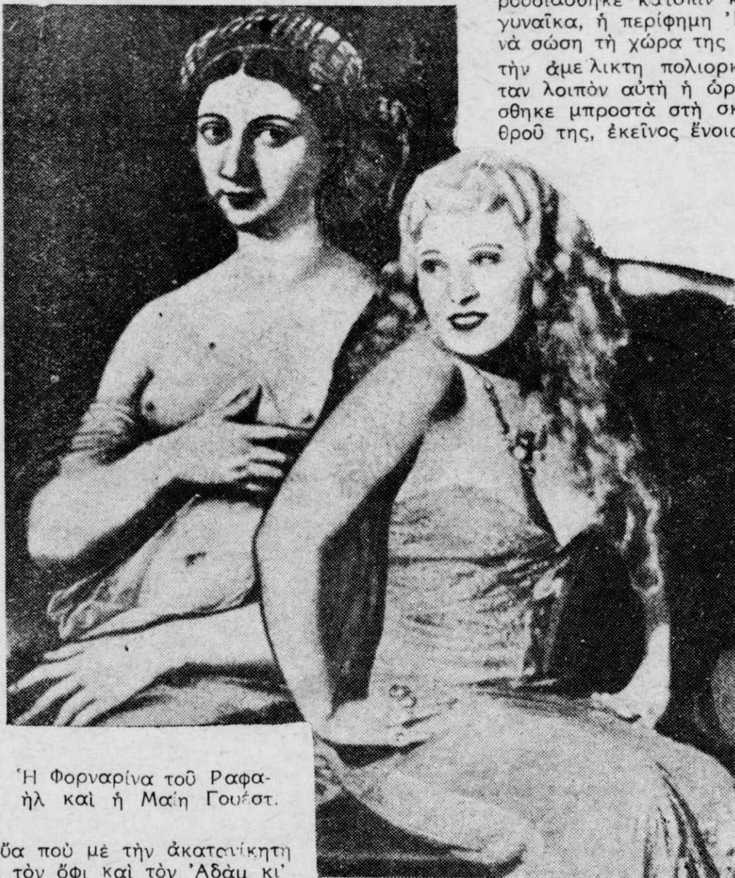
Ἡ Φορναρίνα τοῦ Ραφα- ήλ καὶ ἡ Μαίη Γουέστ.

Τί εἶνε ἡ «μοιραίες» γυναῖκες; Εἶνε ἡ Κίρκης ποὺ κυ- κλοφοροῦν ἐλεύθερα στὸν κόσμον γιὰ νὰ θρῖσκουν τὰ θυ- ματὰ τους. Ὅταν ἓνας ἀντιπρόσωπος τοῦ «ἰσχυροῦ φύλου» συναντήσῃ μιὰ ἀπὸ αὐτὲς, χάνει τὸν ὕπνον του, τὴν ἡσυχία του, τὸ μυαλό του, τὴν ὑγεία του καὶ τὰ λεφτὰ του. Βέ- βαια, μιὰ γυναῖκα δὲν γεννιέται «μοιραία», ὅπως μιὰ ξαν- θειὰ ἢ μιὰ μελαχροινή: γίνεται «μοιραία» καὶ γιὰ νὰ γίνῃ στάνει νὰ θῆθῃ κά- ποιος «διαφημιστής». Ἐνας ἄνθρωπος δη- λαδὴ, ἔμπορος, τρα- πεζίτης ἢ ἀργόσχολος γιὰ νὰ ἐκμυστηρευθῇ στοὺς φίλους του τὴν ἀπόκρυφη ζωὴ αὐτῆς τῆς γυναίκας, τὰ θυ- ματὰ της, τὶς κατα- στροφές της, τὶς ἐρω- τικὲς τραγωδίαις της. Ἔτσι, μὲ τὸν πιὸ ἀφει- δῆ τρόπο, φαμπρικά- ρει τὴ «μοιραία» γυ- ναῖκα κι' ἐκείνη τότε ἢ δυστυχισμένη, γιὰ τὴν ἀξιοπρέπεια τῆς ρήμης της, βλέπει πὼς εἶνε ὑποχρεωμέ- νη νὰ κρατήσῃ θέ- λοντας καὶ μὴ αὐτὸ τὸ παράξενο παιγνίδι σ' ὅλες τὶς εἰκοσιτέσ- σερις ὥρες τῆς ζωῆς της. Μιὰ «μοιραία» δὲν μπορεῖ νὰ κοιμη- θῇ ὅπως ἐγὼ κι' ἐ- σεῖς. Ἐχει ἀνάγκη ἀπὸ ἀρώματα ποὺ δη- λητηριάζουν τὴν ἀτιμό- σφαιρά της, ἀπὸ δέρ- ματα «τίγρων», ἀπὸ μετάξια καὶ ἀτλάζια, ἀπὸ μιὰ ἀφάνταστη πολυτέλεια. Καί, δυ- στυχῶς, ἡ ἱστορία εἶ- νε γεμάτη ἀπὸ «μοι- ραίες» γυναῖκες.