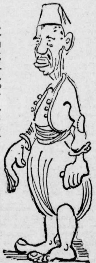
Ἦταν ἓνας χαμένος ἀράπης

Ὅλος ὁ κόσμος ξέρει, πῶς οἱ πιὸ κουτοὶ καὶ οἱ πιὸ ἀκοινώνητοι ἄνθρωποι τῆς ἐποχῆς ἐκείνης ἦσαν οἱ Καρατζοβίτες Τούρκοι. Ἐρχόντουσαν ἀπὸ τὸ θράδου