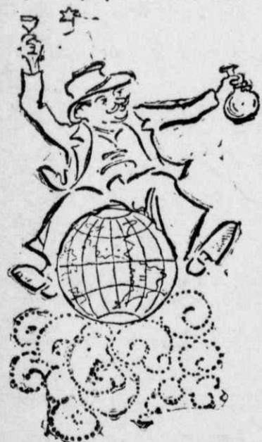
Κ' ὄλος ὁ κόσμος ἦτανε δικός τους.

— Νὰ εἶνε τῶρα κάμποσα χρόνια ἀπὸ τότε. Φτώχεια καὶ τότε δυνατή. Μὴ νομίζετε πῶς ἄλλαξαν ὁ κόσμος, ἄλλαξαν, εἶπα, μονάχα, τὰ πρόσωπα. Κατὰ τ' ἄλλα ἢ ἴδιες ἢ κακομοιρίες, ἢ ἴδιες δυστυχίες, ἢ ἴδιες ἢ ἀνέχειες... Σφαῖρα ὁ κόσμος καὶ γυρίζει, μὰ καὶ δὲν φεύγει ἀπὸ τὴ θέσι του.