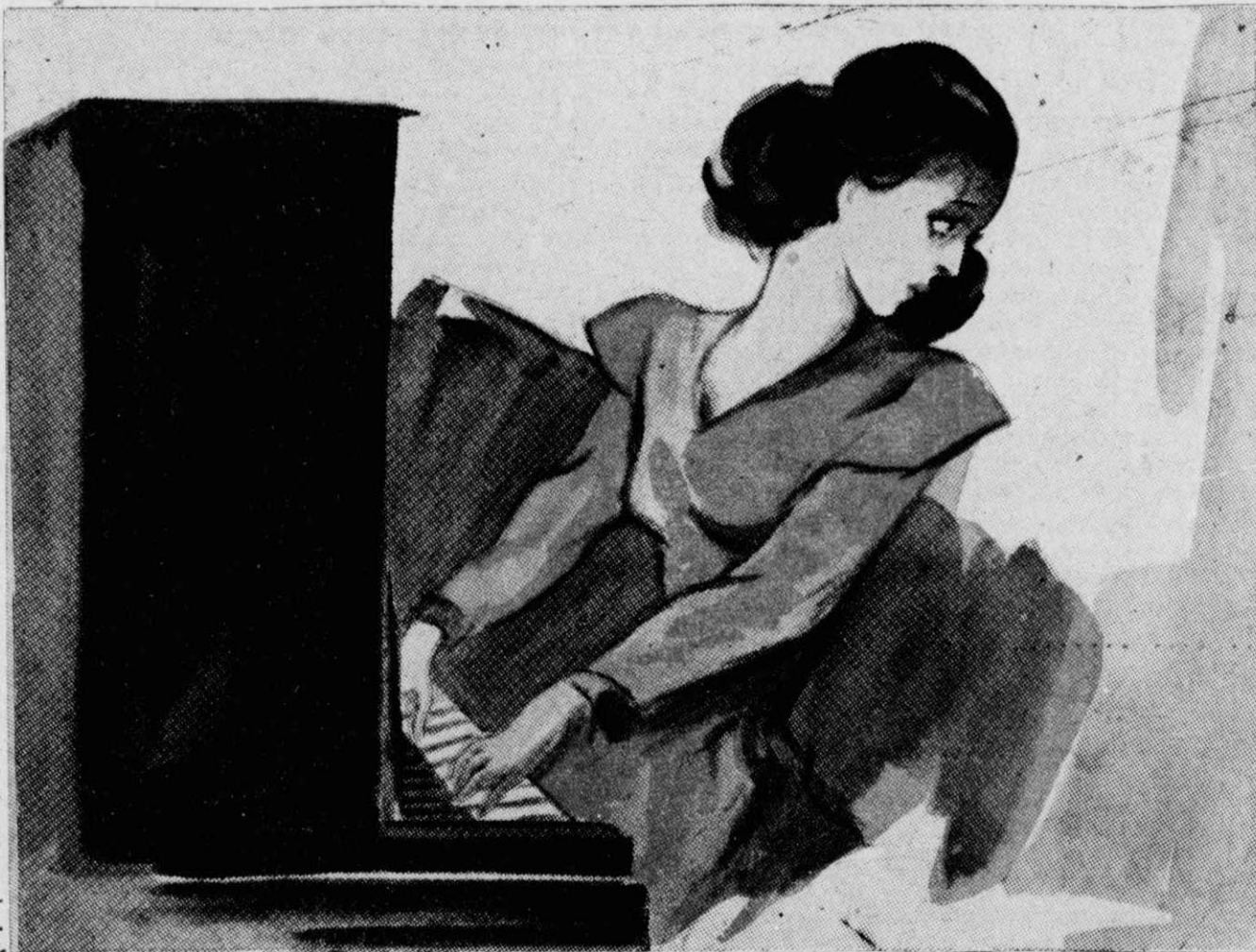
Μονάχα παίζοντας πιάνο, αισθανόμουν κάποια εύχαρίστησι...

Κατάλαβα ό-τι ή μαμά θά είχε τή διάθεσι νά μου ά-