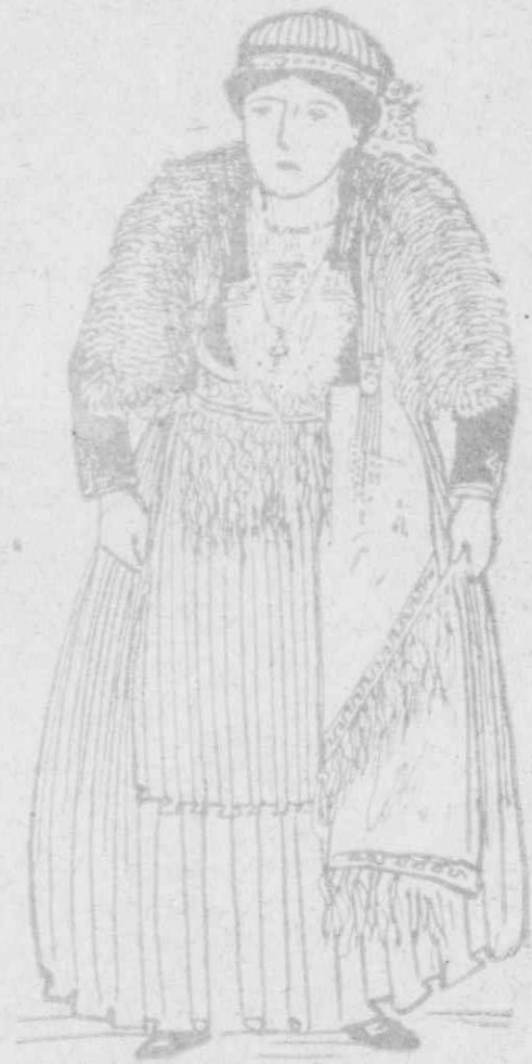
Νιαουστινὴ ἀρχόντισσα μὲ τὴν γιορτινὴ στολή της.

Θεμιστοκλῆν Ρ. — Ἡ πάθησίς σας δὲν πρέπει νὰ σᾶς ἀπελπίξῃ διότι τὰ ἀρτηριακὰ φυσημάτα ὀφείλονται ἐνίοτε εἰς τὴν ἀναιμίαν, χλωρῶσιν καὶ καχεξίαν οὐχὶ δὲ εἰς ἀλλοιώσεις τῶν ἀγγείων. Συσιστῶ τόνωσιν τοῦ ὀργανισμοῦ καὶ παρακολούθησιν ὑπὸ τοῦ ἱατροῦ σας.