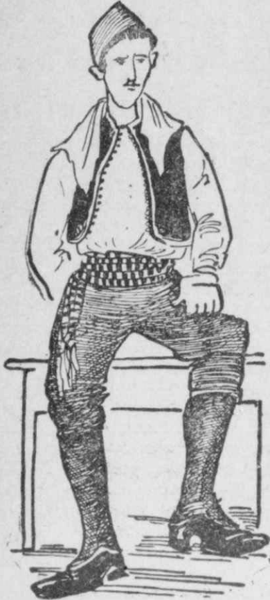
Τύπος γαμπρού, από τα χωριά της Νιάουσσας.

Νιάουσσα, η πιο περίεργος πόλις της Μακεδονίας. Μάντσεστερ της Ελλάδος, ως πόλις βιομηχανική, όλο το Έτος και Νίκαια της Ελλάδος, για μία εβδομάδα, την εβδομάδα των Απόκρεω.