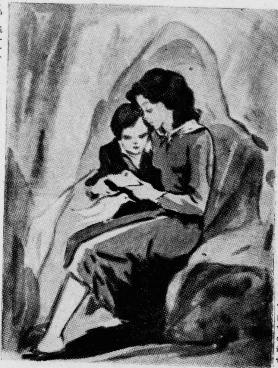
Ὁ Γιαννάκης κάθησε κοντὰ τῆς καὶ ἡ Μηλιά διάβασε