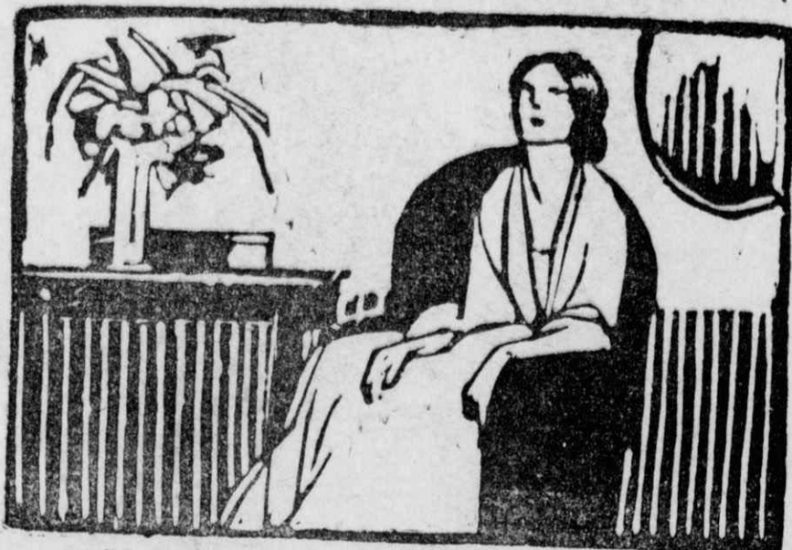
...Όσο βρίσκομαι στην κρεββατοκάμαρα η καρδιά μου σφίγγεται.

Σφύριξα ένθαρρυντικά στο άνατριχιασμένο ζώο, προσκαλώντας το να μπή μέσα και νάρθη κοντά μου. Αλλά ο σκύλλος μου, πιό τρομαγ-