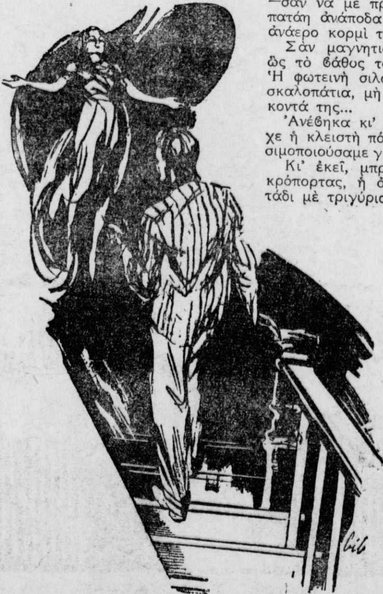
Ἀνέβηκε τὰ σκαλοπάτια καλῶντας με με γλεψίματα κοντὰ της.

Μπαίνοντας μέσα στὸ σπίτι, ἀνάψαμε ὅλα τὰ ἠλεκτρικά. Τὸ ἄπλετο (Συνέχεια στὴ σελίδα 45)