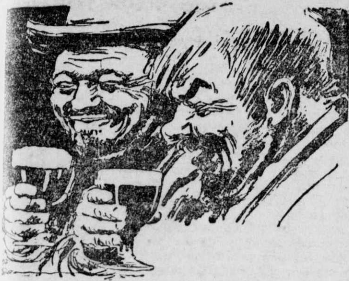
Οί άνθρωποι... καταβόθρες!...