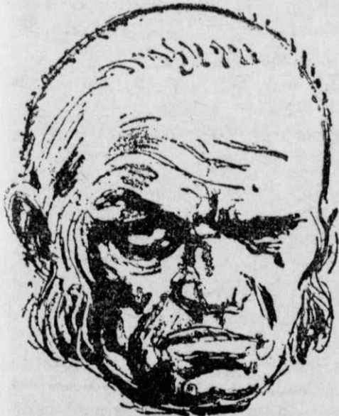
“Ο «πατέρας του 'Εγκλήματος»!...