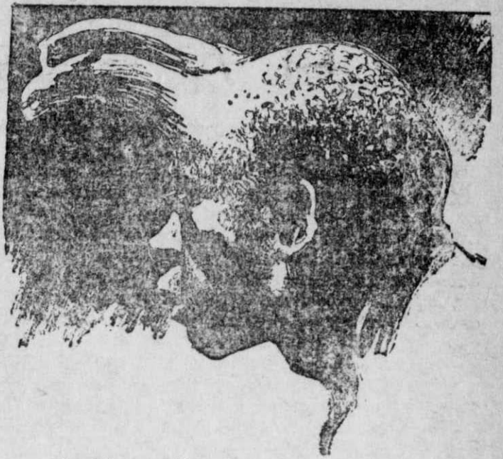
Ντούλον - Καφφίρ, ο κερασφόρος !

“Αξίζει λοιπόν, η δέν αξίζει στον παπα-Γιάννη Κρετιέν, ο τίτλος του ως «πατρός του 'Εγκλήματος»;