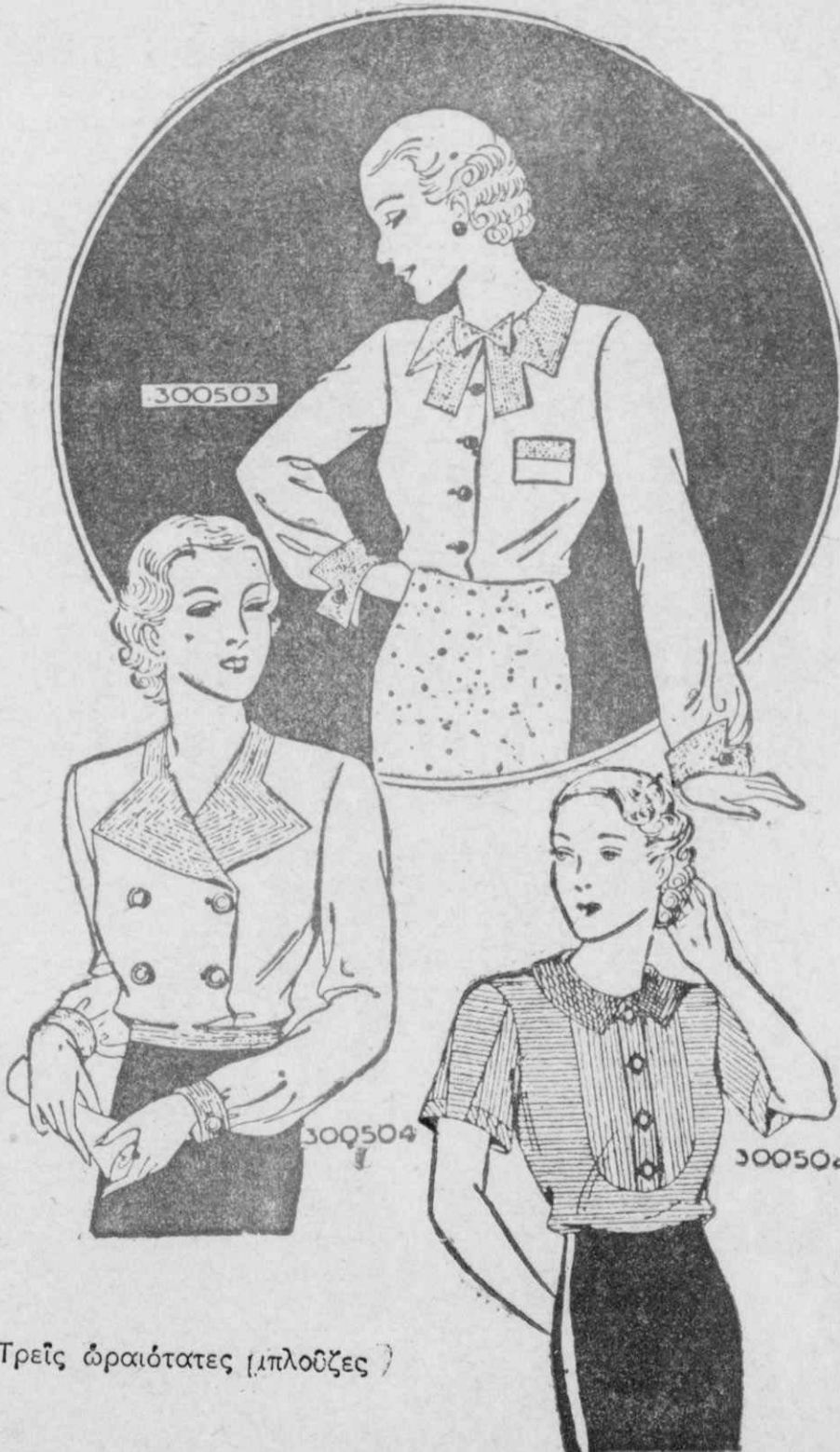
Τρεις ωραιότατες (μπλούζες)