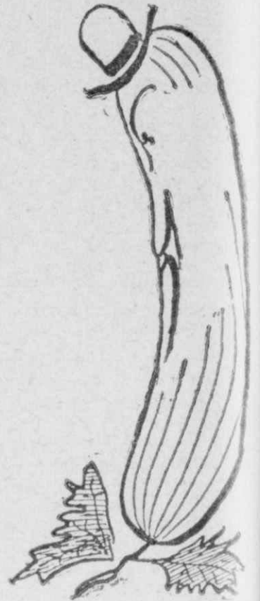
—Σύ έχεις έντίμους συγγενείς, τὰ άγγουρία, σπουδαιώς τιμωμένους από τους ανθρώπους.