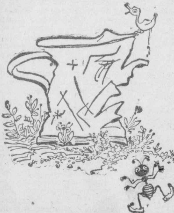
“Ένα τρύπιο και σκουριασμένο ντενεκέ...

Είπαν ότι θα μελετήσουνε τό ζήτημα πριν άρχιση ή καλοκαιρινή σαίζόν.