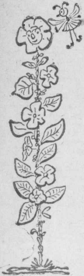
Η κυρία Δενδρομολόχα ήταν μιά κυρία, ύψηλης περιωπής

Μιά γίδα, με γένεια μακρὰ, δεθείσα εκεί πέρα κατέφαγεν ό (Συνέχεια στην σελ. 44).