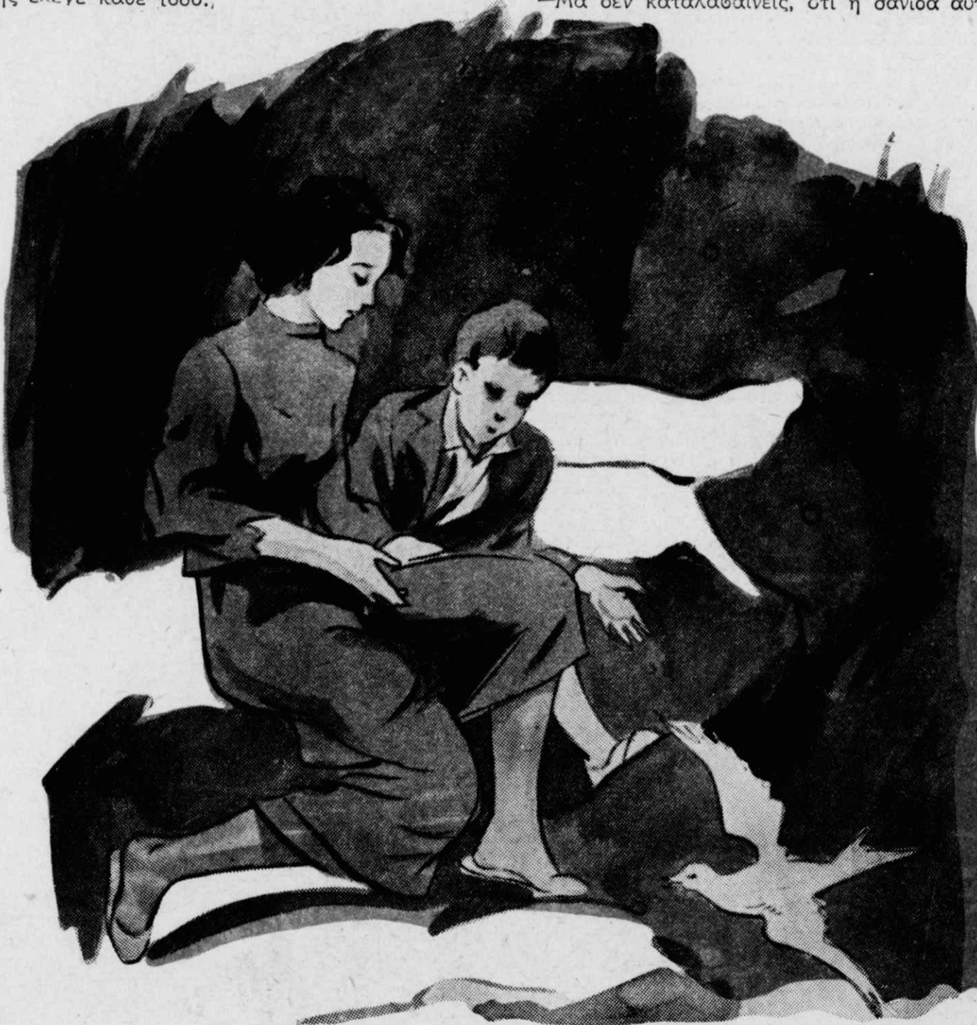
Ἀνοίγοντας τὰ φτερά του, ἔτρεξε γιὰ νὰ φάῃ...