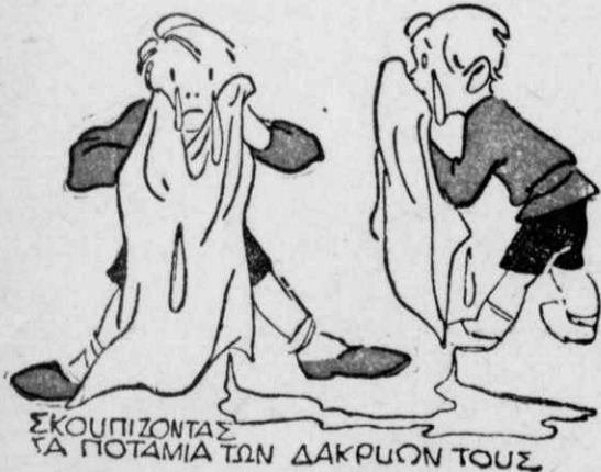
ΣΚΟΥΠΙΖΟΝΤΑΣ ΤΑ ΠΟΤΑΜΙΑ ΤῶΝ ΔΑΚΡΥῶΝ ΤΟΥΣ

νὰ τίς ξοδέψη ἐλεύθερα, μὰ ὄχι καὶ ἄσωτα, γιὰτὶ ἡ ἄσωτεία εἶνε ἀμαρτία. Καὶ σὲ ἄλλες εἰκόνες τέλος θὰ τὸν ἔβλεπαν ν' ἀρνιέται μεγαλόψυχα νὰ φανερώσῃ τὸ κακὸ μαγκόπαιδο, πού τὸν περῆμενε κάθε μέρα στὴ γωνιά τοῦ δρόμου, τὴν ὥρα, πού σχόλαζε ἀπ' τὸ σχολεῖο καὶ τοῦ ἔδινε κατακεφαλιές, κυνηγώντας τον ὡς τὸ σπιτί του.