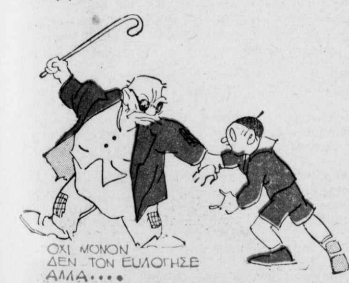
ΟΧΙ ΜΟΝΟΝ ΔΕΝ ΤΟΝ ΕΥΛΟΓΗΣΕ ΑΜΑ...

Αὐτὸ τὸ παιδί δὲν εἶχε ποτὲ τύχη. Τίποτε δὲν τοῦ συνέβαινε ποτὲ, ὅπως τὸ περίμενε. Τέλος, μιὰ μέρα πού ἔφαχνε νὰ βρῆ κακὰ παιδιά γιὰ νὰ τὰ κατηγήσῃ, βρῆκε μιὰ συντροφιά ἀπ' αὐτὰ μέσα στὸ παλὸ πωριτιδοποιεῖο τῆς πόλεως. Τὰ μαγκόπαιδα αὐτὰ μὴ βρίσκοντας ἄλλο τρόπο νὰ διασκεδάσουν, εἶχαν δέσει καμμιά δεκαπενταριά σκυλιά ἐπὶ τὴν σειρά καὶ τὰ εἶχαν στολίσει μὲ ἄδειους τενεκέδες νιτρογλυκερίνης δένοντάς τους ἐπὶ τὴν οὐρά τους.