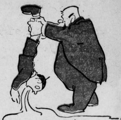
ΤΟΥ ΕΒΓΑΛΕ ΕΝΑ ΤΟΝΟ ΝΕΡΟ. . .

ΤΑ ΒΙΒΛΙΑ ΔΕΝ ΑΝΕΦΕΡΑΝ ΠΟΥΘΕΝΑ ΤΙΠΟΤΑ ΤΕΤΟΙΟ