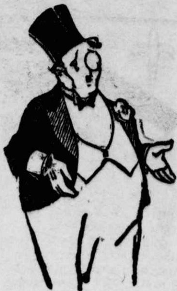
ΜΕΓΑΛΑΙ ΜΟΡΦΑΙ ΤΟΥ ΚΛΗ- ΡΟΥ ΜΑΣ