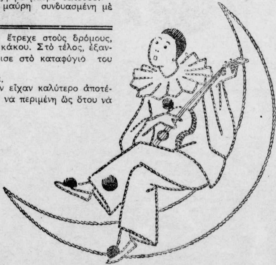
Κέντημα γιὰ μαξιλάρι.