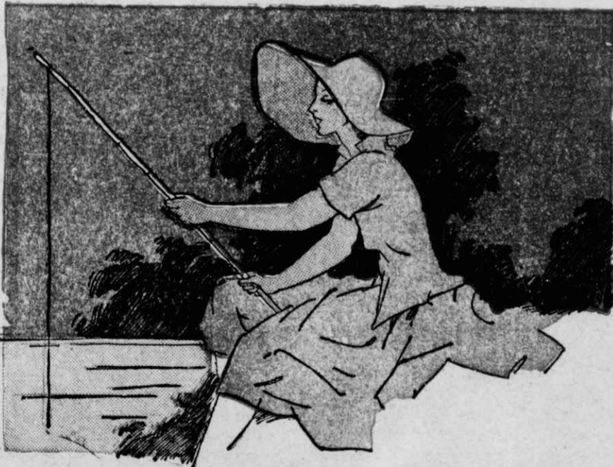
Στὴν ἀπέναντι ὄχθη μιὰ νέα ψάρευε.

Μὰ ἡ δυστυχία τὴν περίμενε ἔξω. Οἱ κλέφτες πού εἶχαν κλέψει τὰ ρούχα τοῦ Σμυτσκόφ εἶχαν πάρει καὶ τὰ δικά τῆς ρούχα καὶ δὲν τῆς εἶχαν ἀφήσει παρὰ μόνο τὸ κουτί πού εἶχε τὰ σκουλήκια γιὰ