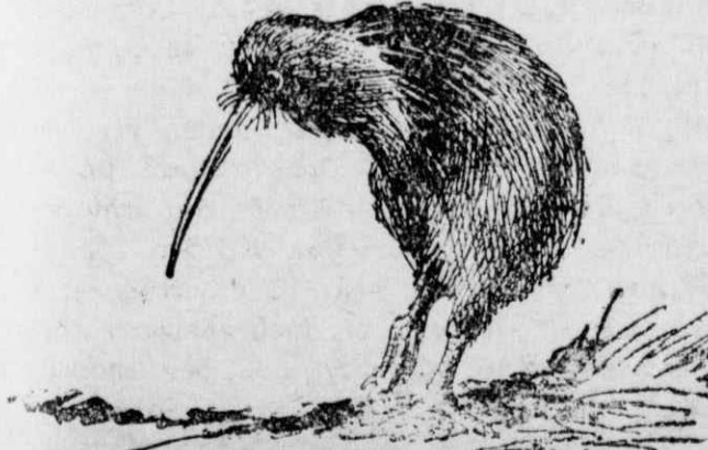
Το άπτερο πουλί «κίβι-κίβι»

Ωστόσο, δεν άντέχουμε στον πειρασμό και τούς τόν παρουσιάζουμε στη σχετική εικόνα μας, μαζί με την ιδιόχειρη ύπογραφή του. Υπάγεται, βλέπετε κι' αυτός, στα πιο αξιοπερίεργα φαινόμενα, για την