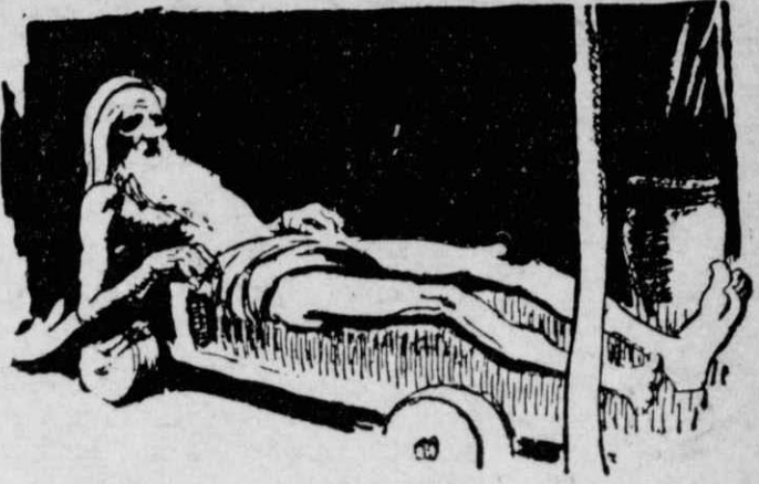
Ο φακίρης Σάντ-Χούς, της πόλεως Μπενάρες των 'Ινδιών.

του, τα οποία αποτελούν το όνομά του, μπορούν να αναμιχθούν ανάμεταξύ τους κατά τέσσερες χιλιάδες διαφορετικούς τρόπους κι όμως πάντοτε να προφέρουν τα «Σαίξπηρ»! «Αν δεν μας πιστεύετε, σάς παραπέμπουμε στο σύγγραμμα του γλωσσολόγου 'Αλεξάντερ Τζών Έλλις, το οποίο επιγράφεται «Συμβολή εις την εξέλιξιν της αναρχίας, της παρατηρουμένης εις την προφοράν της αγγλικής γλώσσας», όπου θα βρῆτε κι' ολοκληρον τον κατάλογο των τεσσάρων χιλιάδων διαφορογραμμένων ονομάτων «Σαίξπηρ»!