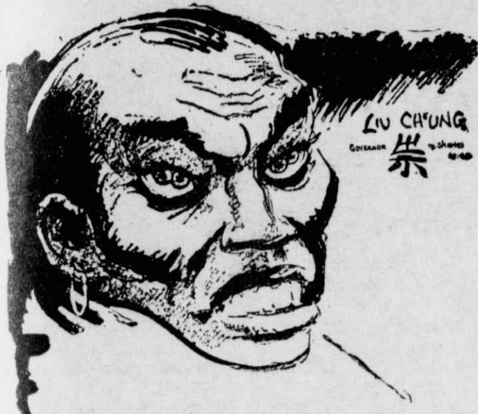
LIU CH'UNG GOVERNOR 崇

Ο Κινέζος μεγιστάν Λιού - Τσουγκ - Λιού - Μίν, ο οποίος γεννήθηκε με διπλές κόρες στο κάθε του μάτι.