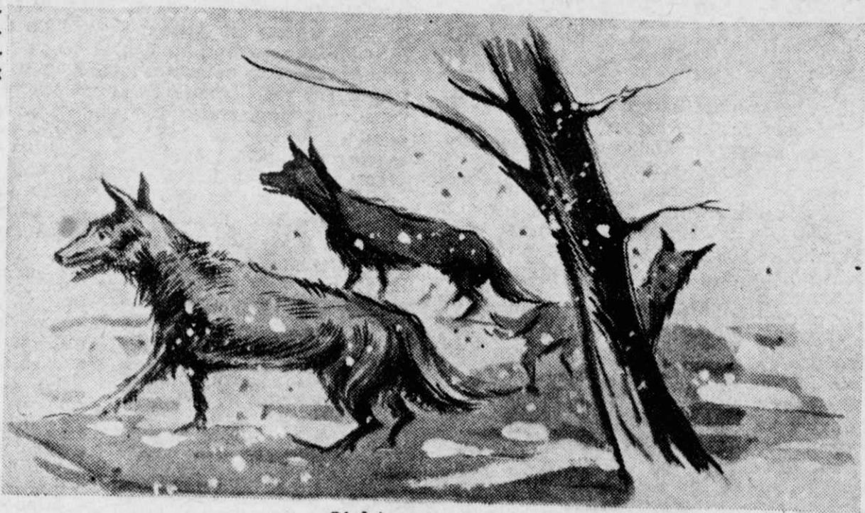
Οἱ λύκοι ξαναγύρισαν