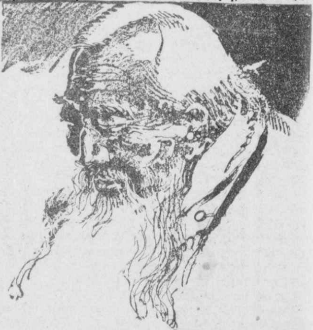
«Ο Κινέζος «Α-Κουέι», ο πιο εύτυχής παππούς της γής...»

Δηλαδή, το όλον όχτακόσια όγδόντα όχτώ παιδιά.!»