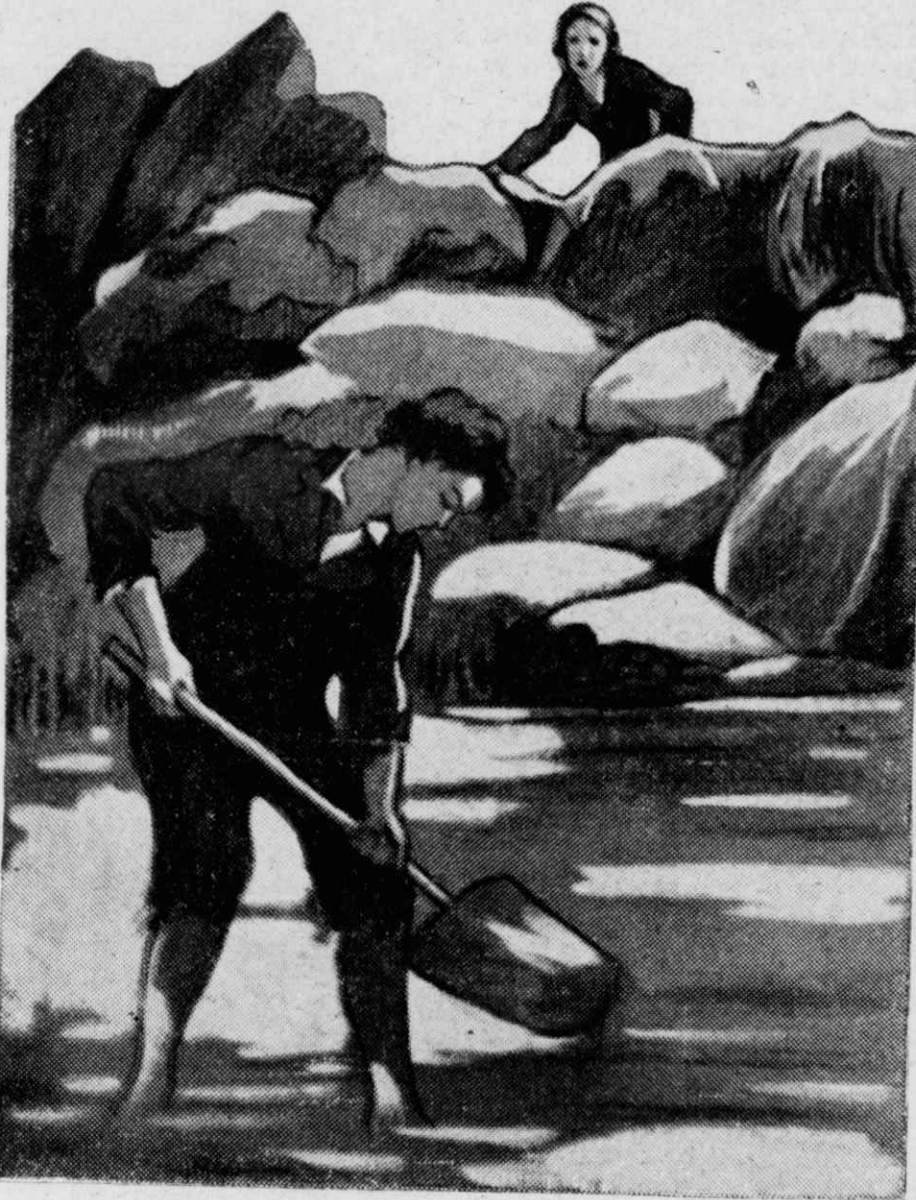
Ὁ Γιαννάκης ἄρχισε νὰ σκάβῃ τὴν ἄμμο.