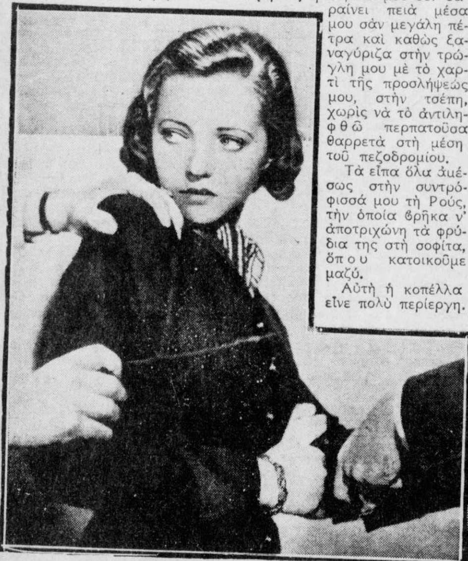
Οι αστυνομικοί με συνέλαβον

«Αντι να ευχαριστηθώ που βρήκα δουλειά, ρίχτηκε επάνω μου σαν μαινάς.