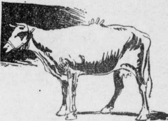
Η μοναδική στον κόσμο άγελάδα του Ντένβερ, ή όποια έχει μαστούς και στη ράχι της!...

καμιά φορά, το «Εθνικό Μουσείο» στην πόλι Μεξικό της Άμερικης, θα δήτε σε μια αίθουσα του τον καταστόλιστο με καλλιτεχνικά σκαλισματα, στρογγυλό και πέτρινον αυτόν θωμό, τον όποιο βλέπετε στην εικόνα μας.