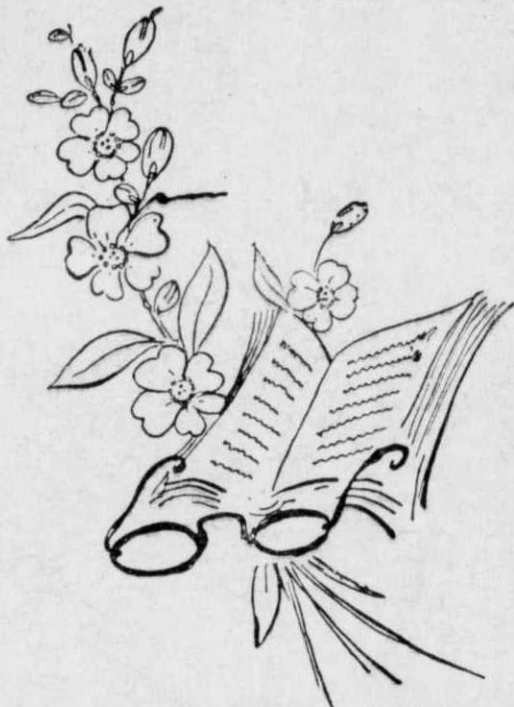
*Αφθίζανε ή άμυγδαλιές

Τής ύγρασίας ή πνοή, και τó άνήλιο του μέρους, του δρουσίζανε τó πρόσωπο και κατεύναζαν του κορμιού του τους άναστατωμούς και καταπραΰνανε του αίματος τή θράσι, τήν