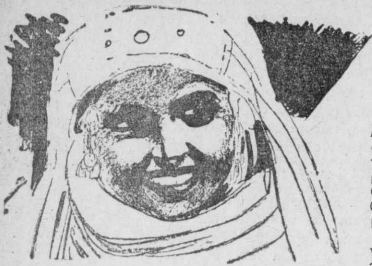
Η Καχένα, σουλτάνα των κουρσάρων της Βερβερίας, Οί πειρα- πούχε στο χαρέμι της... 400 συζύγους!

Πρό εκατό χρόνων, τ ή Μεσόγειο τήν αυλάκω ν α ν τ ά κουρσά- ρικα καρά- βια τών φο- βερών Μπαρ- μπαρί ν ω ν (Βερ β ε ρ ί- ων) πειρα- τών.