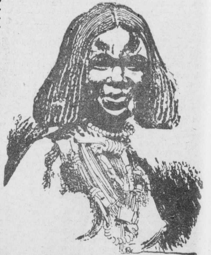
Η πριγκίπισσα Μούμ-Ζι, τής νήσου Καλαβά, πού έγινε γιαγιά σέ ηλικία... 17 έτών!

Αυτό όφειλε- ται, στο ότι τ ά θερμά εκεί ν α κλίματα εύνοούν πολύ τήν πρό- ωρο ανάπτυξη των άνθρώπων..