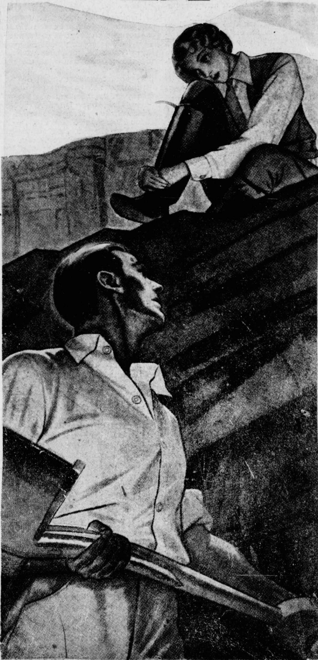
«Έβλεπε μπροστά της τὸν Κλάρκ...»

Κάθε τόσο από τὴν «βίβλα Νάνσυ» του θείου του λάβαινε ένα πολυσέλιδο γράμμα γεμάτο συμβουλές, εύχές και τρυφερά λόγια. Ό θείος του εύχαριστιόταν να του γράφει για όλη τὴ ζωὴ του ύπουστατικού, για τὴν έσοδεία τῶν κτημάτων, για τίς νέες άνορές του και για τὰ καινούργια μηχανήματα που άγόραζε. Ύστερα του ζητούσε πληροφορίες για τὴ ζωὴ του και τὸν ρωτοῦσε άν εἶνε άνάγκη να του στείλει κι' άλλα χρήματα. Τέλος κάθε τέτοιο γράμμα του κα-