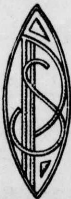
Μονογράμματα γιὰ ἀσπρόφροντα.