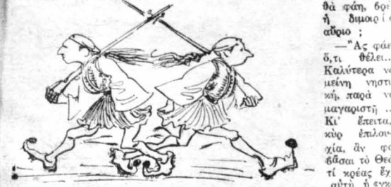
Πρὸι-πρὸι, πρὶν νὰ φέξῃ, οἱ εὐδῶνοι φύγανε.

— Καὶ τί θὰ φάῃ, βοέ, ἢ δημοσίαι αἰδοῦ ; — Ἄς φάει ὅ, τι θέλει... Καλύτερα νὰ μείνῃ νησιώτικῃ, παρὰ νὰ μαγαριστῇ !... Κι' ἔπειτα, κῆρ ἐπιλοχία, ἀν φοβάσαι τὸ Θεό, τί κρέας ἐγ' αὐτὴ ἢ ἐγκαθίστασεν γιὰ νὰ