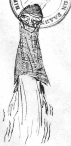
Βρυσηθάνε μιά Τουρκισσα.

— Καὶ τί θὰ φάῃ, βοέ, ἢ δημοσίαι αἰδοῦ ; — Ἄς φάει ὅ, τι θέλει... Καλύτερα νὰ μείνῃ νησιώτικῃ, παρὰ νὰ μαγαριστῇ !... Κι' ἔπειτα, κῆρ ἐπιλοχία, ἀν φοβάσαι τὸ Θεό, τί κρέας ἐγ' αὐτὴ ἢ ἐγκαθίστασεν γιὰ νὰ