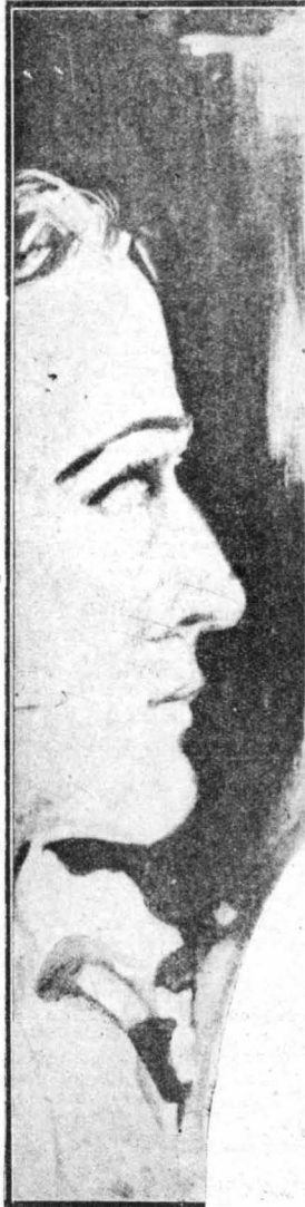
Ἦταν ὁ κόμης Μοντεχρήστος!..