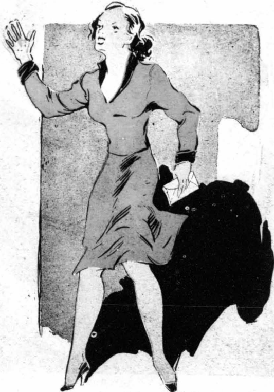
Άνέθηκε τρέχοντας και φωνάζοντας