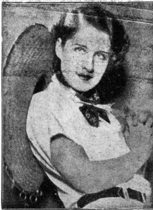
Η γοητευτική καλλιτέχνης τού κινηματογράφου Νόρμα Σήρερ, την όποιαν έθαύμασαν την περασμένη έβδομάδα οι Άθηναίοι ως «Μις Μπs».

— Τό έν λόγω μισκότο διατηρείται σέ άρίστη κατάσταση.