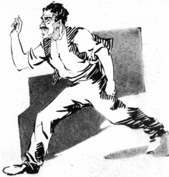
Ό φόβος τού εδινε φτερά στα πόδια !

'Εκοιμήθηκε θαθεία. Κυριολεκτικώς έπήγε στόν άλλον κόσμο