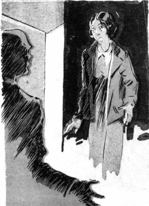
"Η Ντενίς έβγαλε μία φωνή φρίκης.