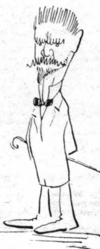
‘Ο κ ‘Αργυρός