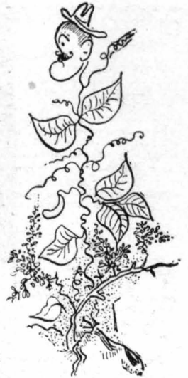
"Έκει άπάνω φύτρωσε και ένας... Φασουλός.