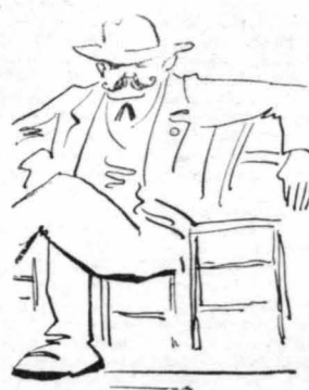
Καθόντουσαν και δροσίζοντουσαν διάφο- ροι Νιγρίταινοι.