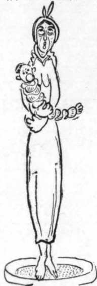
Της δάζουν ένα κόσκιο για να περάση από τόν έρμενον.

"Όταν την περασμένη άνοιξη θέλησα να πάω στη Νιγρίτα, μάζ κινηθήκαμε στον κάμπο των Σερρών οι κερανοί και μάζ δουλάσανε ή λάσπες εκεί κοντά στην Πετοιά και στο Χαρόντος, το χωριό του Καπετάν Μηρούση. Λίγο έλειψε να γινώσκουμ, λέζοι και γεμάτα λάσπες, σάν προπλάσματα άγαλματοποιού, σπην πόλιν των Σερρών.