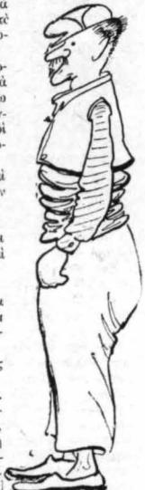
Χωροικός από τη Σουσαμιά.

"Καρεμβιον ή Βασιλιάς, εζονοδοχίον ή Βασιλιάς, εΚαρεμβιον ή Βασιλιάς.