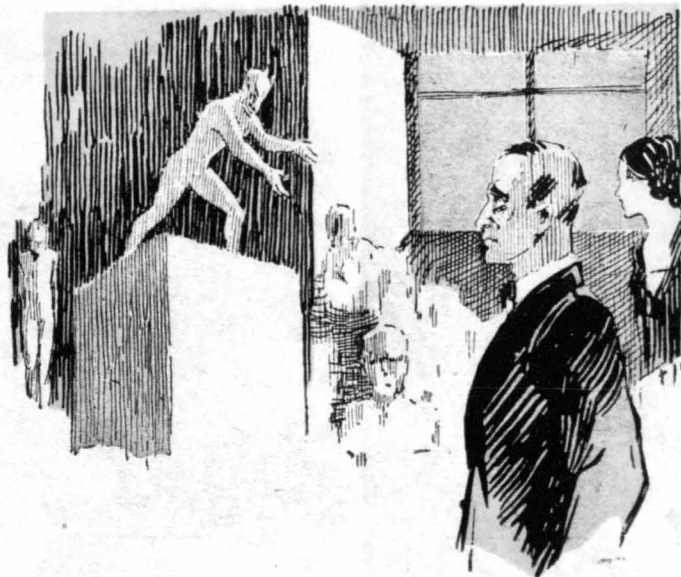
Τό άτελιέ ήταν ένα άπέραντο δωμάτιο, γεμάτο άγάλματα