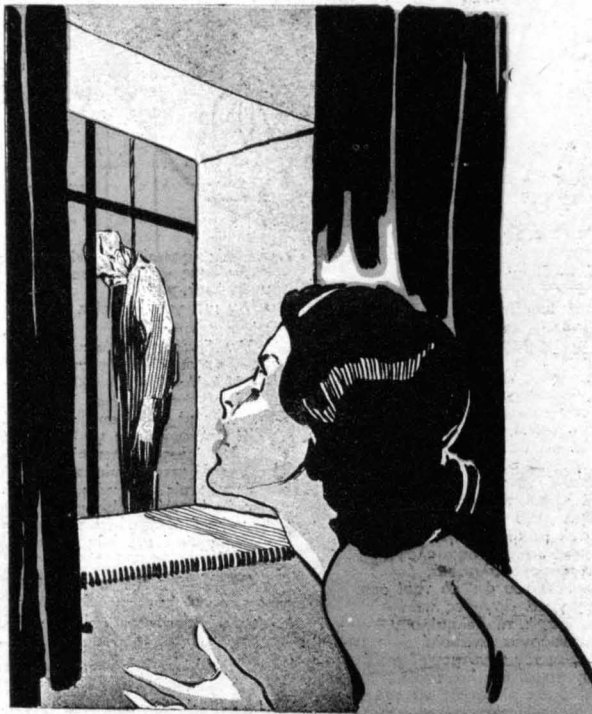
'Ό θείος Σουλθαίν ήταν κρεμασμένος έξω άπ' τό παράθυρο.