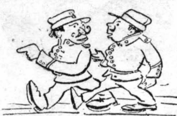
Ζευγάρι ταυρασιμένο κ' άχώριστο!...