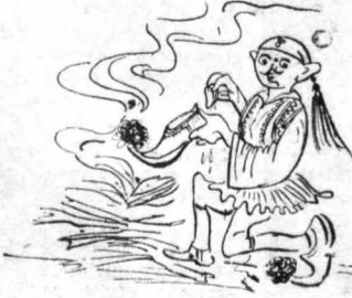
Κρατούσαν από πάνω τα ταυράχια τους σαν να τα έβηναν