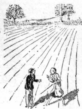
ΤΟ ΔΙΑΤΙ ΚΑΙ ΤΟ ΔΙΟΤΙ