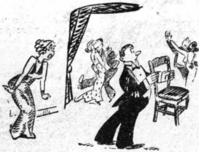
ΕΝΑΣ... ΙΖΕΝΤΑΜΑΝ !