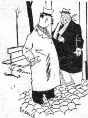
ΤΙ ΕΠΛΘΕ ;

— Το θαλάντιόν σου ἦ τὴν ζωὴν σου. — Εὐχαριστῶς, φίλε μου, νὰ σοῦ δώσω τὸ πορτοφόλι μου. Ἄλλὰ θά μοῦ ὀποσχέθῃς προηγουμένως, ὅτι δὲν θά θυμώσῃς ἀν δὲν βρῆς τίποτε μέσα !