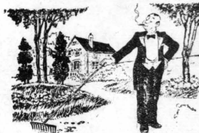
Η ΑΥΝΑΜΙΣ ΤΗΣ ΣΥΝΗΘΕΙΑΣ

Ἐκεῖνος. — Ἄν ἤθερα πὸς ὁ σύζυγός σου ἔλαιτε χθές, θά ἔμπαιναν τὴ νύχτα στὴν κἀμαρή σου... Ἐκείνη. — Πῶς ;... Δὲν ἤσουν λοιπὸν ἐσὺ αὐτὸς ποῦ ἤθερε τὴ νύχτα ;