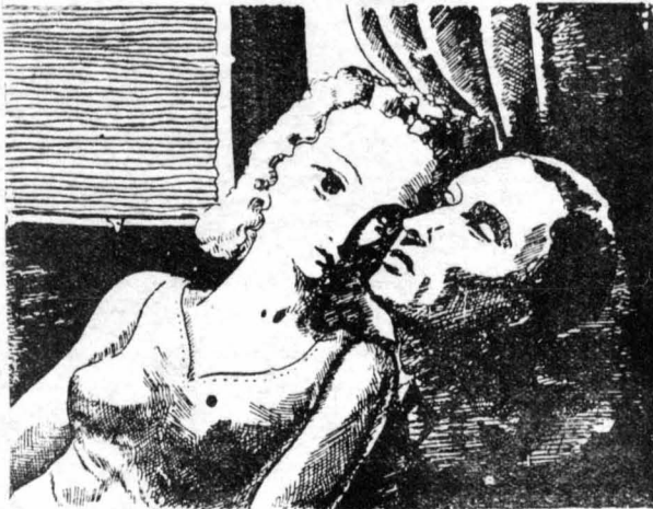
Ταξίδευαν γιὰ τὸν... Παράδεισο!..

— Μὰ πὺς! ἔκανε ἀξάφνα ὁ κύριος, που ἦταν πάντα καλὰ πληροφορημένος, μ' ἕνα εἰρωνικὸ χαμόγελο. Δὲν τὸ μάθατε; Οἱ ἐρωτευμένοι μὰς παντρεύ-