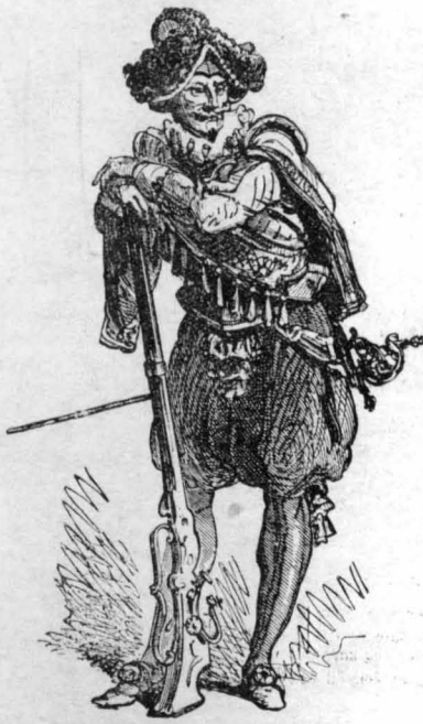
Ο Λησάχου Μαντρέν

Στό προσέχει θά διηγηθούμε και άλλα καταπληκτικά κατορθώματα του περιφήμου αυτού λησάχου.