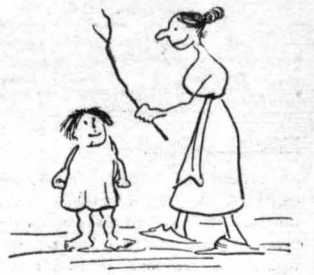
Βαγγελιώ τήν έλεγε ή μόνα της στό χωριό της