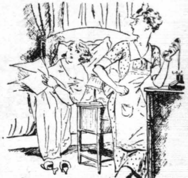
Η ΜΟΝΤΕΡΝΕΣ ΚΑΜΑΡΙΕΡΕΣ