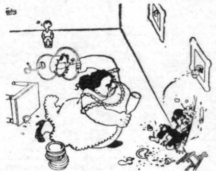
ΤΟ... ΑΔΥΝΑΤΟ ΦΥΛΛΟ

— Τὸν βλέπετε αὐτόν; Ἐπαίξε τὸ ρόλο τοῦ Χριστοῦ στὸ φιλμ «Ὁ Γολγοθάς»! — Δόξα σοὶ ὁ Θεός! Θὰ τοῦ ἔπλυνε, ἐπι- τέλους ἡ Μαγδαληνή, τοὺς πόδας!