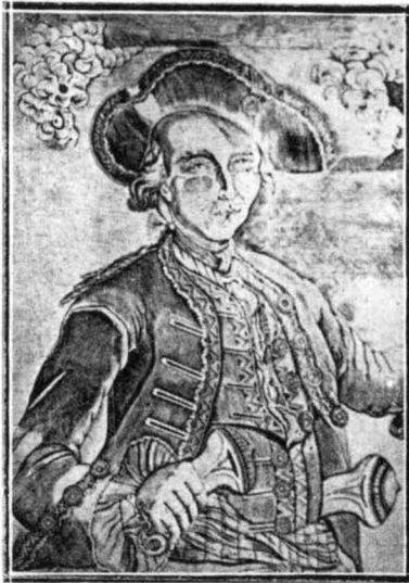
Ο Λήσταρχος Μαντρέν (Γκραβιέρ της εποχής)