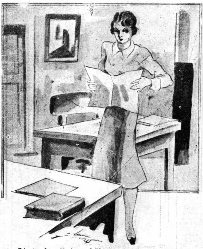
—Για μία εινε, συλλογιτση, ή Εδουχία και με λειε σπουλαγαμνημένη»

Μικρή ή Άρσινόη υπέφερε άπο άδυνατοθια. Όλοι έλεγαν πώς ειχε κάποια προδιόθεσι για φθίσι. Για τήν ώρα όμως ήταν καλά στήν ύγεια της κι' ή άδνεξ όλες, εκτός από δυό τρέψ που έπέμειναν, τής ειχαν ξεποισθεί. Μπορούσε τέλοσπαντων νά ζήμα, ειμι γοι νά βοηθή από τό σπίτι της; περισοτίσω από τής άλλες. Το δίσωμά τής άπ' τό ύγειο δέν τό ειχε ποτέ άκόμα, κι' ίσως δέν θα τόκωιανε ποτέ. (Χρειάζοιαν τόση μελετη και τόσα λεφτά!...) Ήταν όμως καλή δασκάλα, κι' έξειδή ήταν και «καλό κορίτσι», ειχε κάποιες μαθήτριες, δοχάριες, που μεριζες, για να πληρώνουν λιγώτερα, έκαναν τό μάθημα του πιάνου στό σπίτι της. Τά γλίσχηρα αυτά δίδακτρα ήταν ο κυριώτερος πόρος τής οί-ογένειας. Μαζένοίταν ως δυνόμου χιλιάδες. Άλλες χιλίες έπαινε ή Εδουχία στού Σαρββίδη. Κέρδιζε δέν κέρδιζε άλλες τόσες ο κίρω Χρησίος; άπ' τής «δουλειές του ποδιού». Και κανένα πεντακοσάρικο ή μικρή άπ' τής τής νταντέλεξ της. Μόλις και μεταβίξες δηλαδή ειχαν πένετε χιλιάδες τό μήνα. Κι' άκόμα λιγώτερα τό καικοκίρι, που πολλές μαθήτριες τής Άρσινόης έφραγαν... (Άκολουθεί)