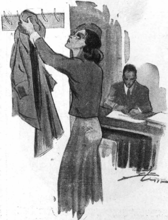
Ἐβγαλε τὸ πανωφόρι τῆς καὶ τὸ μπερὲ τῆς καὶ τὰ κρέμασε.

Μὲ τὸ νέο τῆς προϊστάμενο—ἦταν εικοσιεῖς χρονῶν—τὰ πῆγαινε θαυμάσια. Τὴν ἐκτιμοῦσε, τὴ συμπαθοῦσε καὶ τὴ λυπόταν ὁ Πετράκης. Ποτὲ δὲν ἔβαλε στὸ νοῦ του νὰ τὴν πειραξῆ, ὅχι μόνο γιατί εἶχε ἠθικὲς ἀρχές καὶ σεβόταν τὰ φτωχὰ καὶ τίμια κορίτσια, ἀλλὰ καὶ γιατί αὐτὸν τὸν καρὸ ἦταν ἀρραβωνιασμένος κι' ἐρωτευμένος μάλιστα μετὴν ἀρραβωνιαστικιά του. Ὅταν πρῶτοπῆγε, ἐδῶ κι' ἓνα χρόνον, ἡ Εὐτυχία στὴ δουλειά μόνον τὸ Νίκο βρέθηκε ἀναγκασμένη νὰ βάλῃ στὴ θέσι του (καὶ δὲν δυσκολεῦθηκε, γιατί κι' ἐκεῖνος εἶδε γόγγυρα μετὴν εἶχε νὰ κάνει). Ὁ Πετράκης ὅμως δὲν τῆς ἔδωσε ποτὲ ἀφορμὴ. Κι' ἀπὸ τὴν ἡμέρα ποὺ εἶδε καὶ τὴν ὄραία του ἀρραβωνιαστικιά, τὴ Μαίρη, καὶ κατάλαβε πόσο τὴν ἀγαποῦσε, ἡ