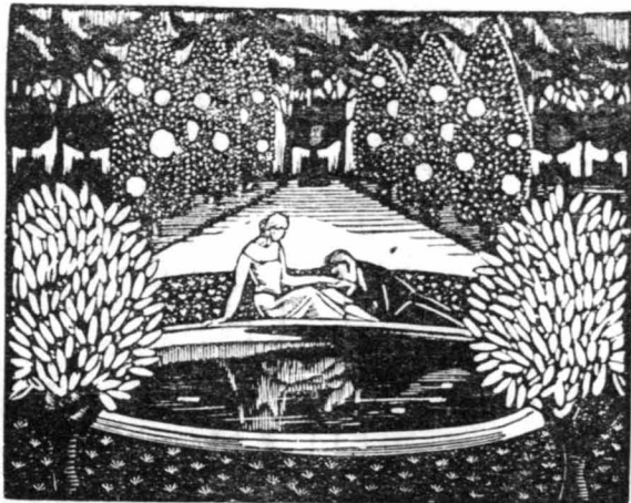
Τη συναντούσα σ' έναν κήπο, πλάι σε μιá στέρνα...

Τό μυαλό μου σκοτίσθηκε και ένοιωσα ένα ρίγος σ' όλο μου το