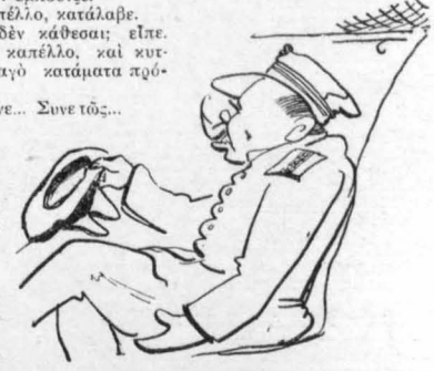
— Πολίτου είνε, συνε τώς!...