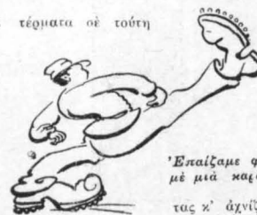
Έπαίξαμε φουτ-μπόλ με μιὰ καραβανα!...