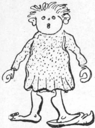
Και κάνα-δυό ξεπόλητοι.

Ξαναγυρίζω πάλι στής καραβάνας τό φουτ—μπόλ. Σάν επροχώρησε ο άνθιπασπιστής, τραβήκαμε κι'