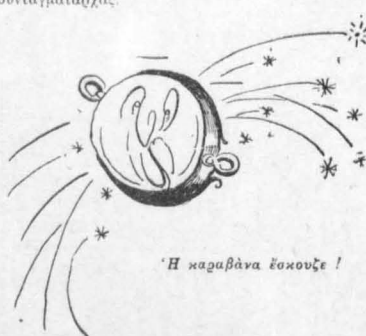
Η καραβάνα έσκούζε!