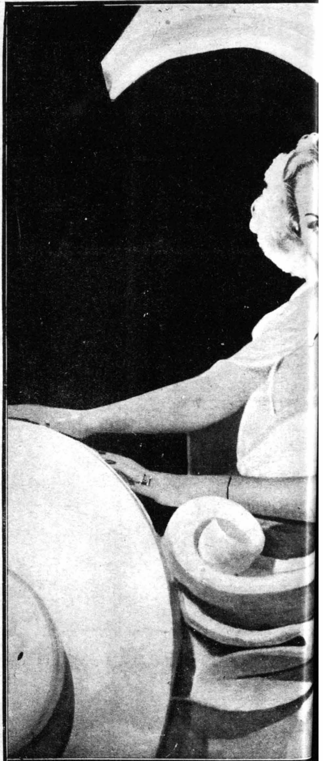
Ἡ ὀρασιότατὴ σιάζ Καρόλ Λομπέρ δ'α; ἐμρνήζετα «Ἡ Τελευταία Ρο