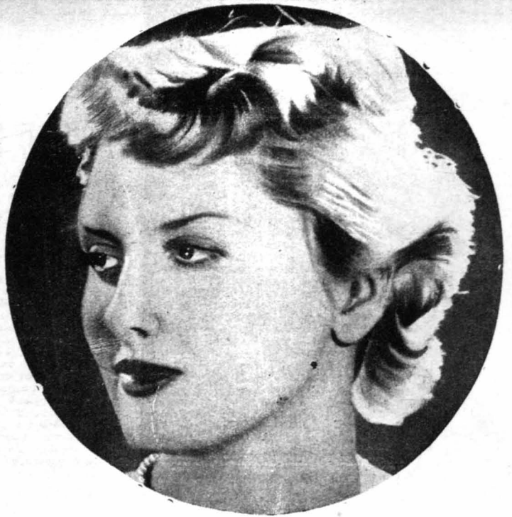
Η Βίνα Βίνφριντ, ένα καινούργιο άστέρι του 'Αμερικανικού κινηματογράφου.