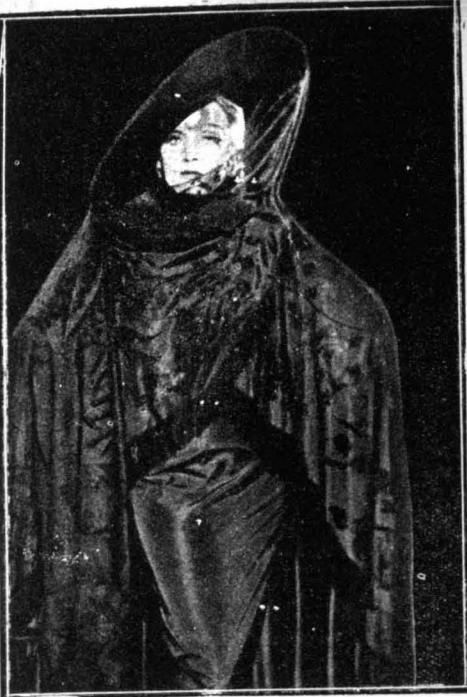
Μιά εξωτική εμφάνισις τῆς «μοιραίας» βεντέτας Μίρλεν Νιήτριχ στο φιλμ «Ἡ Γυναίκα καί τὸ Νευρώπα-το».