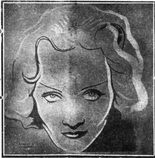
Η Μάρλεν Ντρήτριχ

*** — «Έχω τή γνώμη, λέει ή «Ξανθή Άφροδίτη», ή Μάρλεν Ντρήτριχ, ότι τó γούστο εινε έφαρκο στη γυναικεία και συνεπώς, με λίγη προσοχή, μπορεί να ντύεται όπω; ταιριάζει στόν τύπο τής όμορφης τής κι' όχι όπω; εινε ή μόδα. Άν ύποθέσουμε λοιπόν ότι μία άπό αυτές τισ γυναίκες εινε ξανθή, άγγελική; όμορφη; ο φάρης θά δημιουργήρη τó μοντέλο του έτι τή βάσει αυτού του τύπου τής όμορφης τής. Τό μοντέλο όμως, αυτό δεν μπορεί να φορεθί άτ' όλες τισ γυναίκες. Μόνον έκεινες που εινε ξανθές και έχουν και άγγελική όμορφη μπορούν να τó χρησιμοποήσουν. Άν τó φορέση μία μελαχροινή με μαύρα μαλλιά και φιορέρα μαύρα μάτια, μια σατανική δηλαδή όμορφη, θά δείξη μ' αυτό ότι έχει πάρα πούν κακό γούστο!.. Η μόδα εινε ζήτημα προσαρμωγής; μίς; τουαλέτας; σε μία όμορφη. Μη φτιάχνετε ποτέ ένα φόρεμα, έπειδή πηγαίνει όμορφα σε μία φίλη σας. Φτιάξτε τó φόρεμα που πηγαίνει σ' εσάς. Αυτό εινε τó μυστικό τής κομψότητος.»