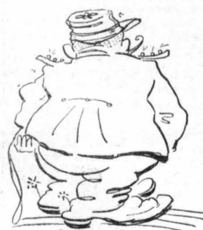
Μιά μέρα παρεστάθη στη θεωρία και ο λοχαγός.

— ‘Εκείνο που...άλεϊβουμε !.. *** Μιά ήμέρα, παρεστάθη, στη θεωρία και ο λοχαγός. ‘Εμεινε ικανοποιημένος και για να φύγη ένελεος ή δουλειά του, κάλεσε έναν φαντάρο να του πη τιό εινε το «έλικαιοσκόπειον ζλατίριο» του τουφεκιού.