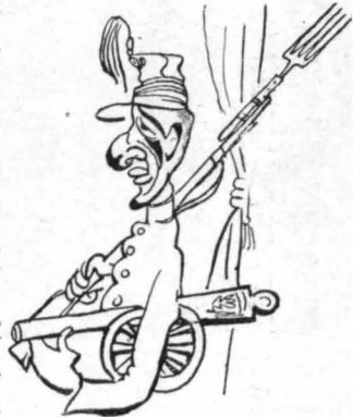
‘Ο Φασουλής του Κράτους ‘ηλαδή...

πας στην Εισαγγελία, να το καταγγείλεις.