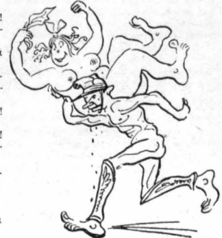
Να την άπήγαγε κανένας νέος Πάρις;