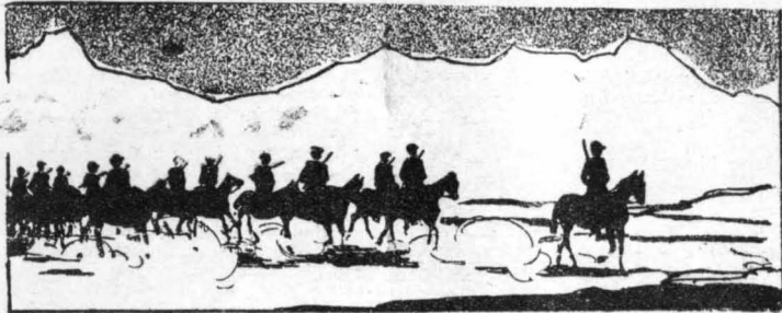
Ξεκίνησαμε, με το λογαγό μου επί κεφαλής...

Ο Μοντεχρήστος σκήρτησε τόσο δυνατά, ώστε ο Κοφολαίμης γύρισε και τον