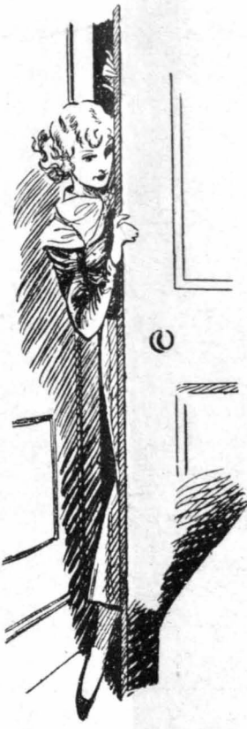
—Είστε μόνη, Μερσεδές; ρώτησε ή μέ

Η μίς Κλαίρου μισόκλεισε τ' μάτια της, σαν ν' άντίκρυζε κάποιο δράμα ύπερφυσικό. Στο μυαλό της κυριαρχούσε άκόμη ή αούτηρη και μεγαλειώδης φυσιογνωμία τού Μοντεχρήστου... Και στηρίζοντας τ' διάφανο