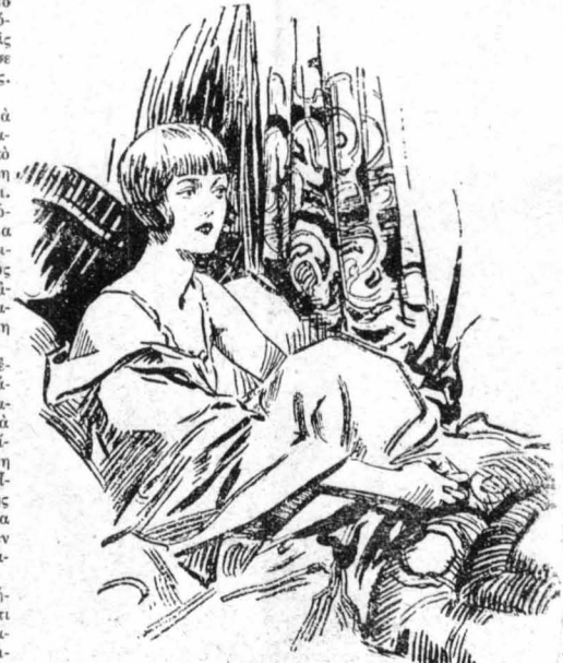
Περνούσε τις ώρες της ξαπλωμένη, με χαμένο το βλέμμα της στο κενό...

Και πράγματι, ο μίστερ Μπράϊαν άκούοιθη κατά φράματα τη σιμδουλή του δόκτωρος. Πυρπόλησε τη βίλλα του, έμεινε άσυγκίνητος από τις σπαρχατικές κραυγές της κόρης του, και μόνο όταν πέρασε η όριμένη ώρα, άφησε τους προσούστες να ερχθουν μέσα στις φλόγες και να βγάλουν τη Μαίρη άνεισθητη από το σπίτι. Ο δόκτωρ Ρούντολφ την εξέτασε τότε προσεχτικά κι' ύστρια άρχισε να την συναφέρει. Όταν η Μαίρη άνοιξε