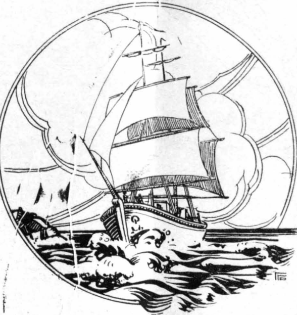
Ένα γιατ τραβεί τή στιγμή αυτή για τού λιμάνι...

—Άκριβώς αυτός! Ψευθρίσε ή Μερσεδες, Ή χρυσοκόκκινη σημαία έίνε τού διακριτικό γνώρισμα τής ιδιόκτητης θαλαμηγού του!... Ω, Θεέ μου, σ' εύχαριστώ που μου τόν στέλνεις τόσο γρήγορα!... Ίσως να μην άντεγα περισσότερο άπ' τήν ά-