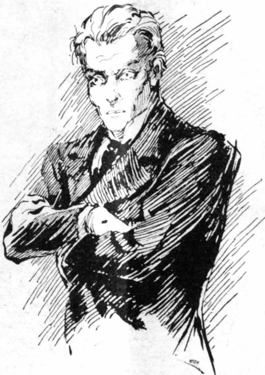
'Ο Μοντερχήτος την άκουγε με τά χέρια σταυρωμένα μπρός στο στήθος...